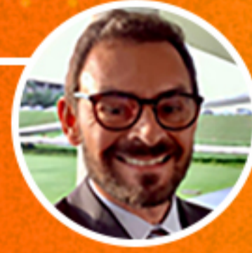
Newton Tavares Debatedor Câmara dos Deputados